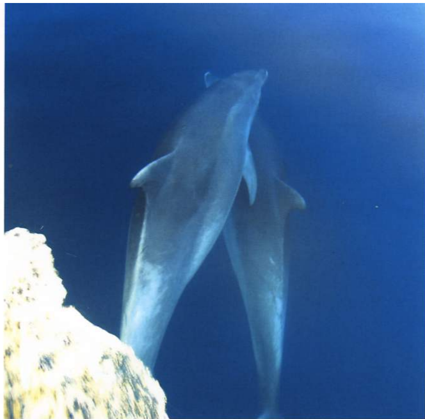
Delfíni před přídří