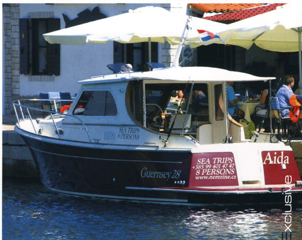
AIDA, Veli Lošinj, centrum pro výzkum delfínů

Ne, to se tam totiž ani nesmí. Podle chorvatských zákonů nesmíte jít do vody s delfíny. Ochránáři mají obavu z nákazy a chorob,